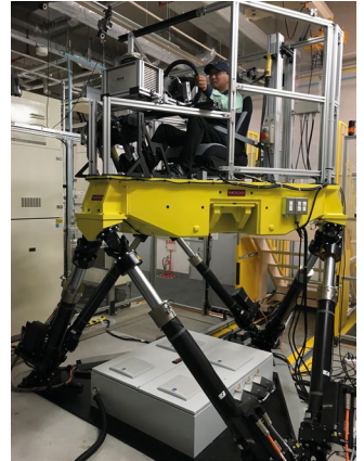
六轴模拟室，以便Archem检查振动和倾斜情况

“我们的办公自动化业务也适应了人们急剧变化的生活方式。我们的优势在于为聚氨酯赋予静电性能的产品设计和生产技术。预计产品结构将随着远程办公的盛行而发生变化——大